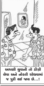
ગામથી સુવાળી તો કોંગ્રેસ લેવા અને નોકરી પોષવામાં ૧ પુરી થઈ જાય છે...