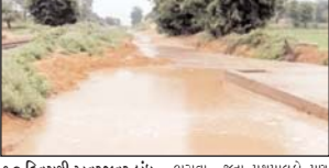
૧૦ દિવસથી અવરજવર બંધ થઈ જતા ગામલોકો ત્રસ્ત

ડીસા તાલુકાના રામસણથી પટેલપુરાને જોડતા મુખ્ય માર્ગ ઉપર રેલવે તંત્ર દ્વારા બનાવેલ અંદર પાસ નાળામાં વરસાદી પાણી ભરાઈ જતા સ્થાનિક ગામલોકો ભારે મુશ્કેલી વેટી રહ્યાં છે નાળામાં વરસાદી પાણી ભરાઈ જવાના કારણે આ માર્ગ મોખાસા દરમિયાન ૧૦ દિવસથી બંધ જતા રહેલું જતા ૩૦૦ થી વધુ બાલકો તેમજ ડેરી અને ઘૂંટી ભરવા જતા પશુપાલકો પણ પારવાર મુશ્કેલી વેટી રહ્યાં છે. ગામ લોકોને એક ગામથી બીજા ગામનો સંપર્ક તૂટી ગયો છે દર ચોમાસે સામાન્ય વરસાદમાં પણ સર્જાતી આ મહા હાલમાં ભાવને તેમજ અવારનવાર તંબોને લેખિત તેમજ મૌખિક રજૂઆત કરી હોવા છતાં આ સમસ્યા નો નિકાલ ના આવાતા આખરે આ ગામલોકોએ સોમવાર જિલ્લા કલેક્ટર ને આવેદનપત્ર આપી પાણીના નિકાલ મુદ્દે ઉચ્ચ રજૂઆત કરી હતી.